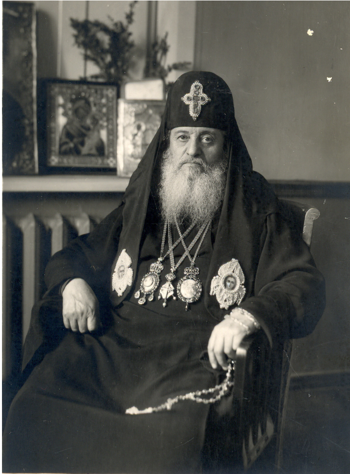
სრულიად საქართველოს კათოლიკოს-პატრიარქი ეფრემ II (1960-1972, სიღამონიძე)