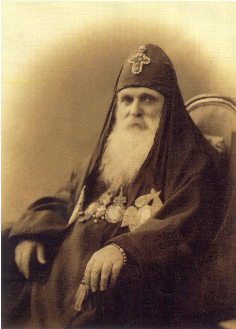
სრულიად საქართველოს კათოლიკოს-პატრიარქი ამბროსი (1921-1927, ხელაია)