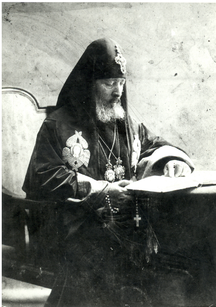
სრულიად საქართველოს კათოლიკოს-პატრიარქი კირიონ II (1917-1918, საბაგლიშვილი)