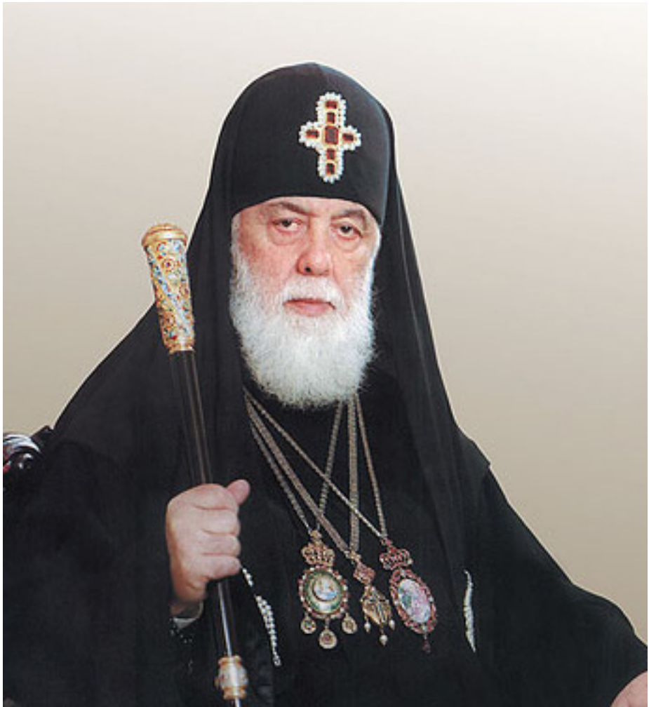
სრულიად საქართველოს კათოლიკოს-პატრიარქი ილია II (1977-დან, შიოლაშვილი)