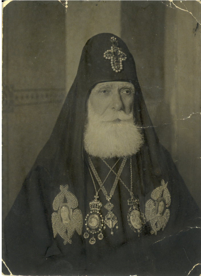
სრულიად საქართველოს კათოლიკოს-პატრიარქი კალისტრატე (1932-1952, ცინცაძე)