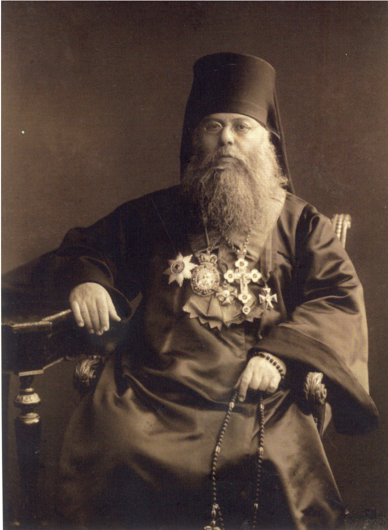
სრულიად საქართველოს კათოლიკოს-პატრიარქის მოსაყდრე, საქართველოს ეკლესიის დროებითი მმართველობის თავმჯდომარე ყოვლადსამღვდელო ლეონიდი (ოქროპირიძე), შემდგომში, 1919-1921 წწ., სრულიად საქართველოს კათოლიკოს-პატრიარქი