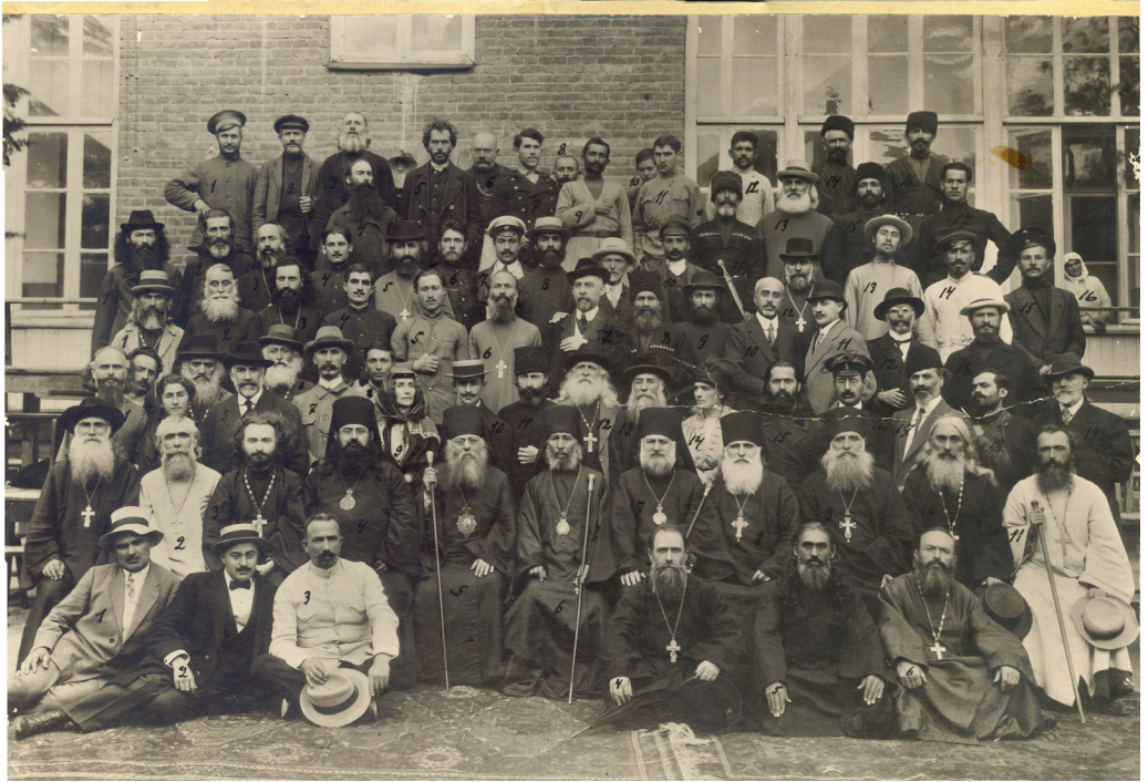
სრულიად საქართველოს I საეკლესიო კრების (1917 წ. 8-17 სექტემბერი) მონაწილენი