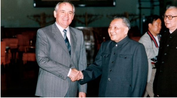
Mikheil Gorbachev and Deng Xiaoping

was the final nail in the coffin, with localized interests soon unraveling the fabric of a system founded on centralized control.