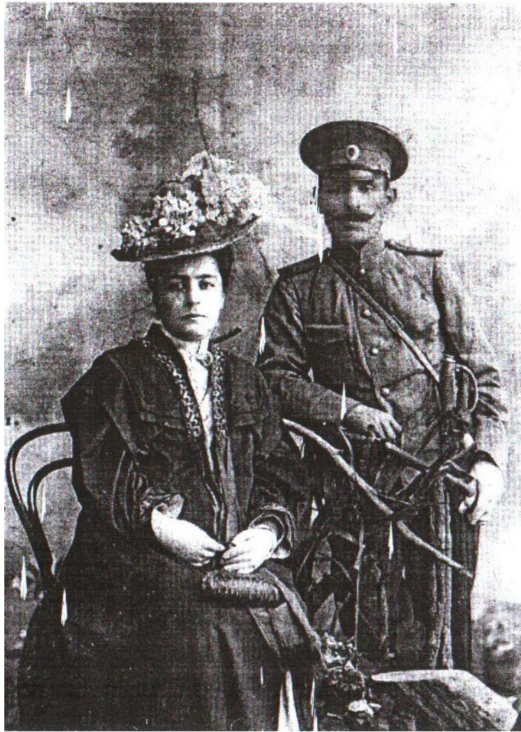
გენერალი გიორგი მაზნიაშვილი მეუღლესთან ერთად