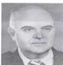
მიხეილ გეგეშიძე 100

21 დეკემბერი - ივანე ჯავახიშვილის სახელობის თსუ-სა და კ. კეკელიძის სახელობის ხელნაწერთა ეროვნულ ცენტრთან ერთად, ჩატარდა აკადემიკოს გიორგი მელიქიშვილის დაბადებიდან 100 წლისთავისადმი მიძღვნილი საიუბილეო სესია.