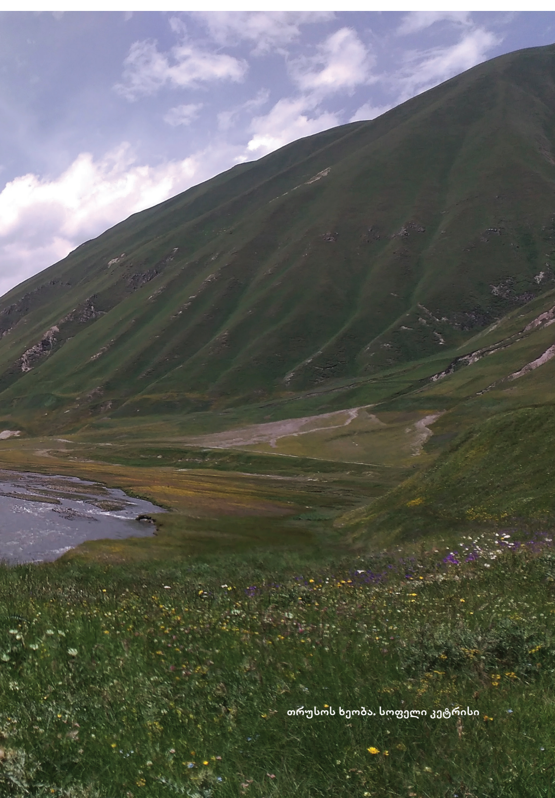
თრუსოს ხეობა, სოფელი კეტრისი