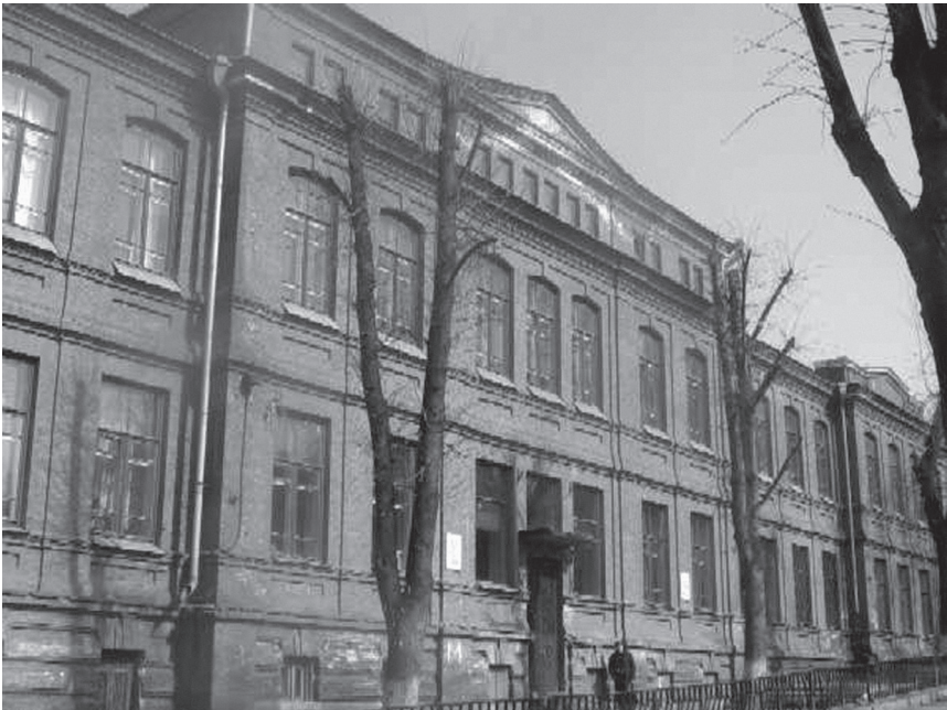
ვლადიკავკაზის ქართული საშუალო სკოლა

გამორჩეული იყო სოფ. კობის სკოლა, რომელიც თვით კობის მოსახლეობამ ააშენა. ამ საქმის ინციატორი იყო ცნობილი მეცნიერის, ლინგვისტ ვასო აბაევის ძმა სიმონი; აბაევები წარმოშობით სოფ.კობიდან იყვნენ. სკოლაში, რომელსაც კომუნისტური ახალგაზრდობის სკოლას უწოდებდნენ და რაიონში