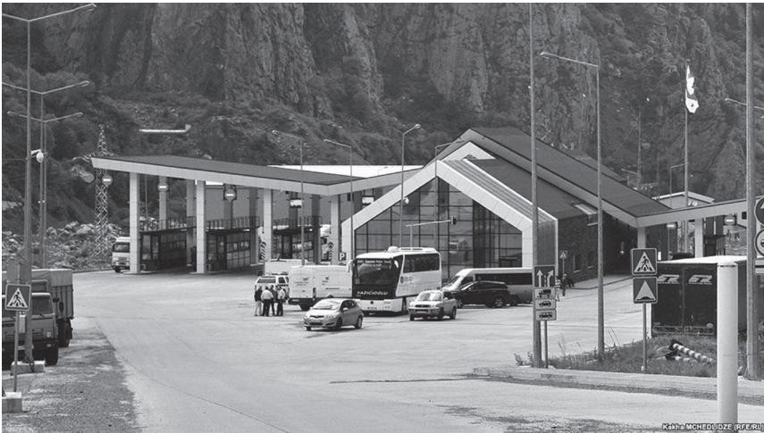
ლარსის საბაჟო-გამშვები პუნქტი.