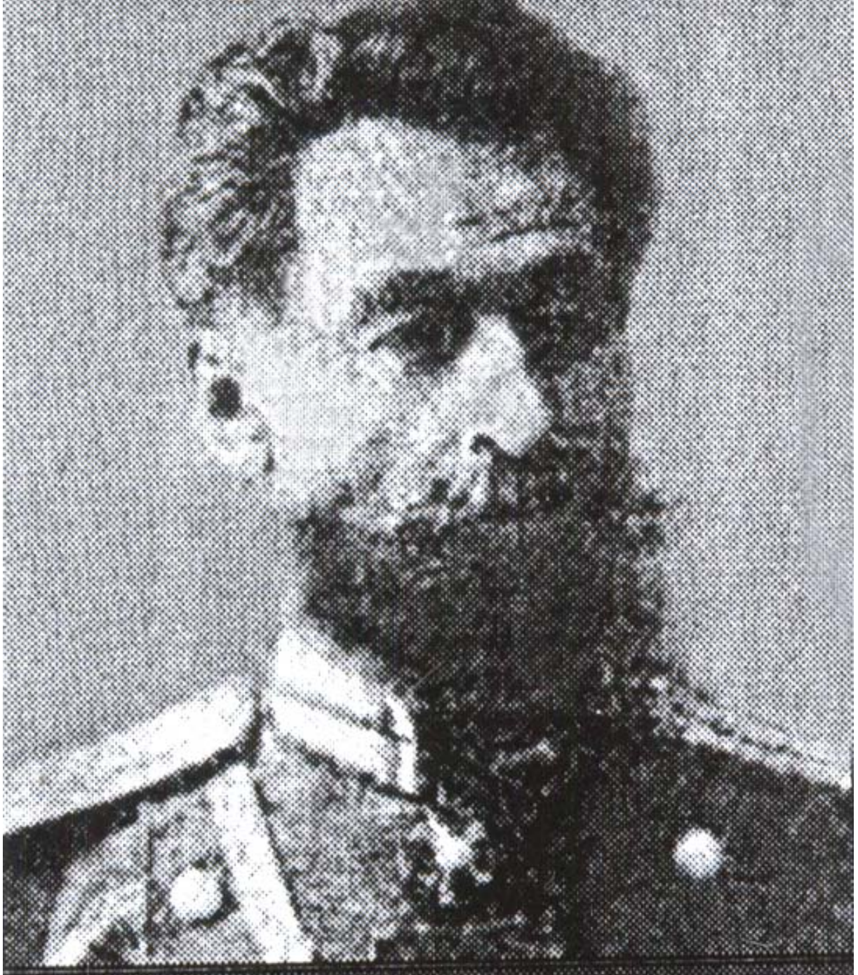
გენერალი აბელ (ბალო) მაყაშვილი